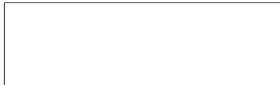
Схема границ эксплуатационной ответственности сторон

Прочие сведения по установлению границ раздела эксплуатационной ответственности сторон _____